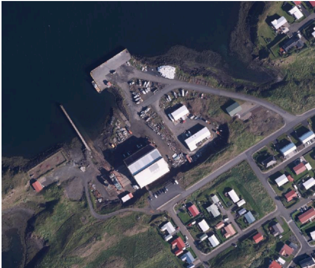
Loftmyndir ehf. Mynd frá 2020

Á svæðinu eru í dag skráðar nokkrar lóðir: Nesvegur 12, 14, 16, 18, 20, 20a, 22, 22a og 24.