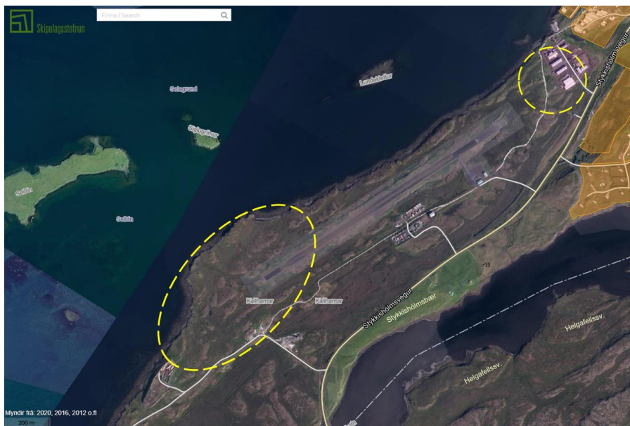
Mynd 1-1 Staðsetning breytinga merkt gulum hringjum loftmyndakort.

Svæðin sem breyting tekur til er sýnd á mynd 1-1. Annars vegar er um að ræða svæði sem verður athafnasvæði A5 sem nær frá suðvesturenda flugbrautar að iðnaðarsvæði (I2) þar sem fer fram urðun óvirks úrgangs og hins vegar stækkun á núverandi athafnasvæði við Hamraenda (A1). Bæði svæðin eru í eigu sveitarfélagsins.