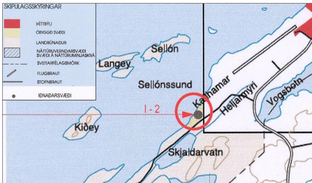
Mynd 2-3 Breytingarsvæðið við Kallhamar sýnt á sveitarfélagsuppdrætti Aðalskipulags Stykkishólms 2002-2022 en það nær yfir óbyggt svæði að iðnaðarsvæði 1-2 við Kallhamar.