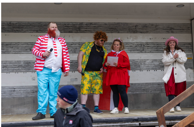
Þessi öflugri hópur stóð fyrir uppboði.