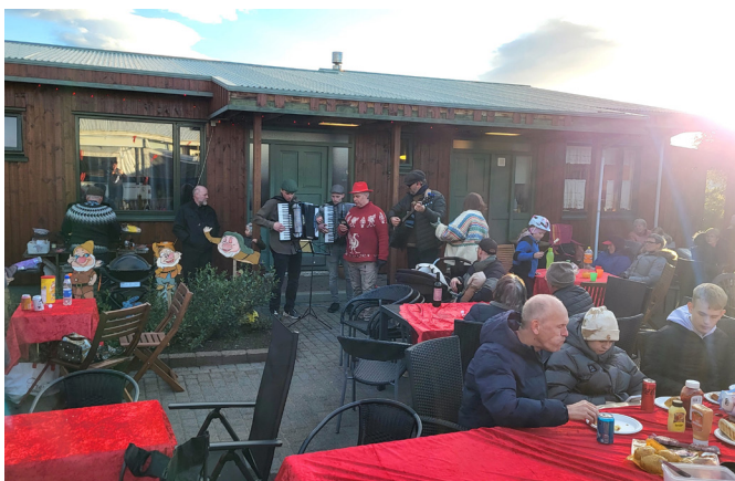
Víða var sungið og spilað fram á nótt.