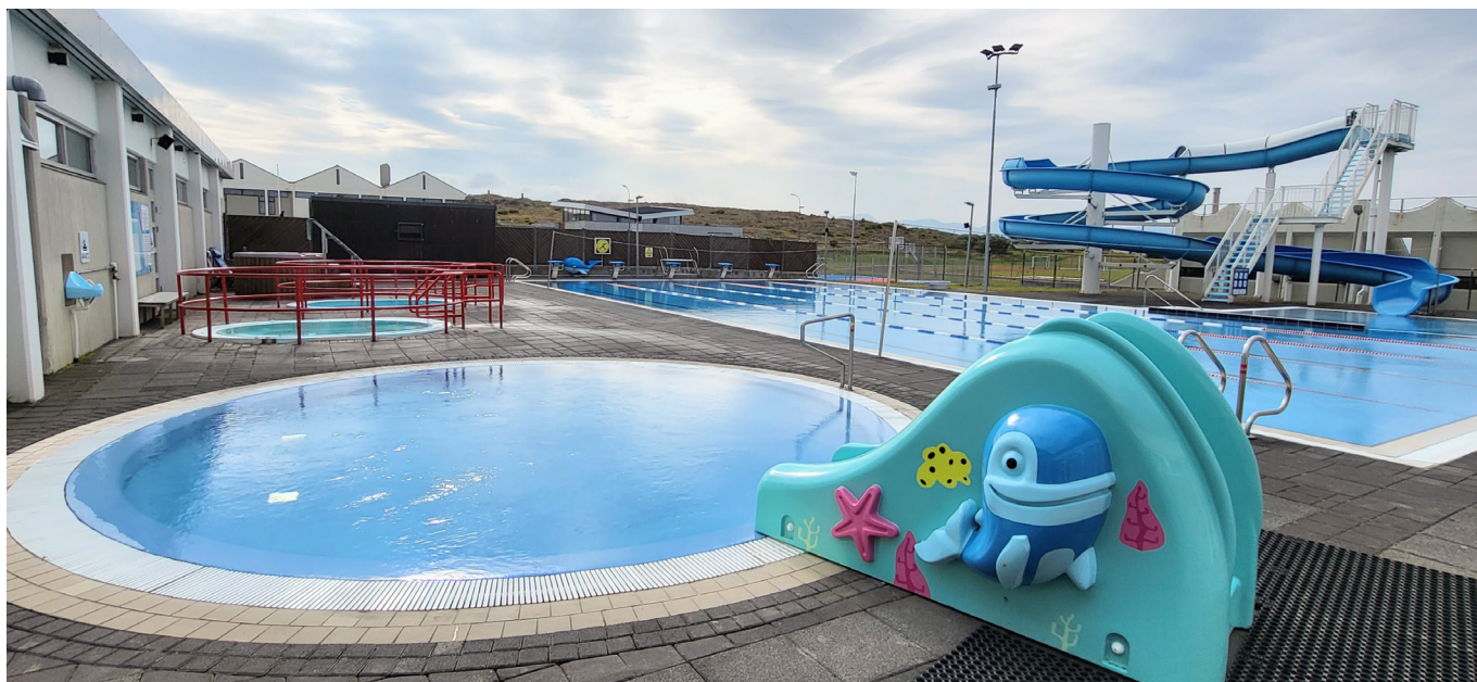
Framkvæmdum við vaðlaug lokið

Í sumar var ráðist í viðhaldsframkvæmdir á Sundlaug Stykkishólms. Eftir að framkvæmdir hófust var ákveðið að skipta um yfirborðsefni