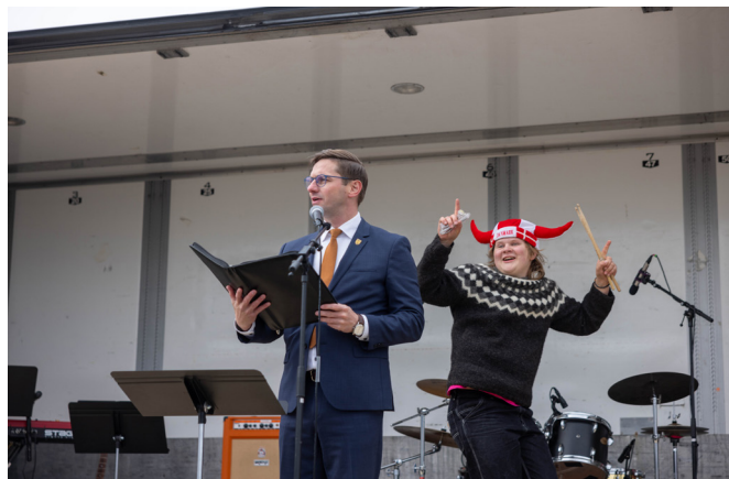
Ungur maður ræður sér vart af kæti þegar bæjarstjóri flytur ræðu sína.