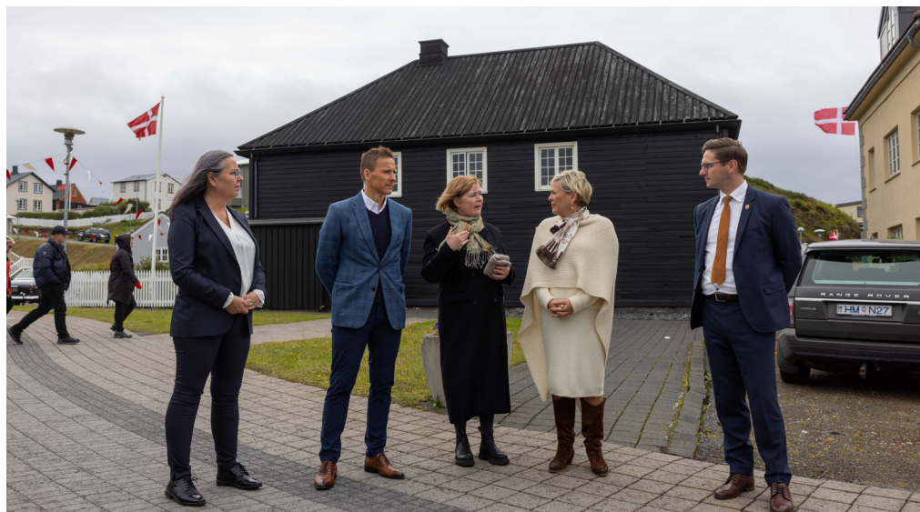
Skipulagsfulltrúi segir forsetahjónum, ásamt bæjarstjóra og forseta bæjarstjórnar, frá áherslum sveitarfélagsins í skipulagsmálum og varðveislu gamla húsa.