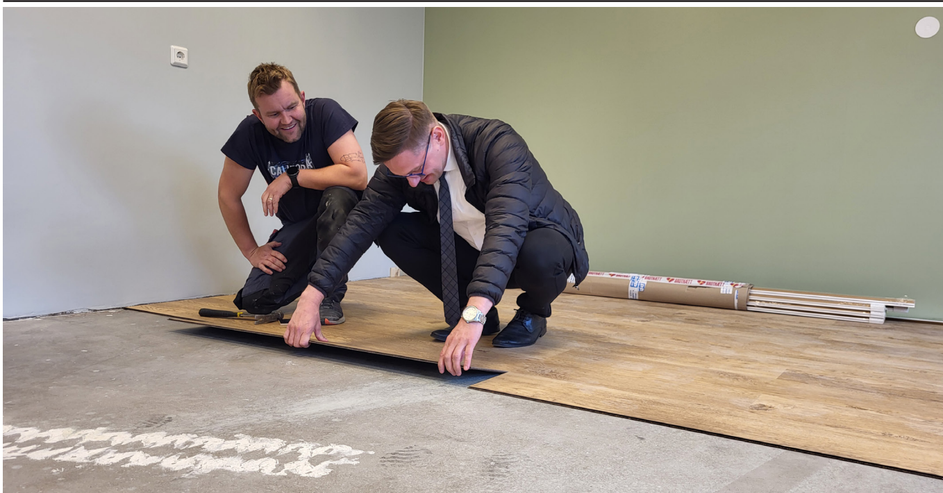
Bæjarstjóri reynir fyrir sér í parketlög.