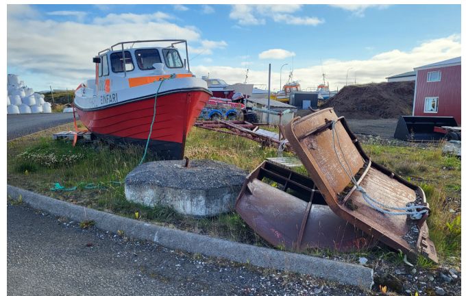
Myndir að svæðinu.