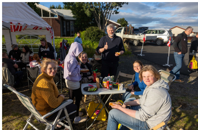
Hverfagrill voru víða vel sótt.