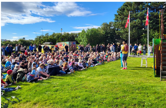
Góð mæting á Leikhópin Lottu á fimmtudeginum.