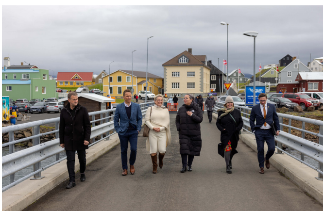
Halla Tómasdóttir, forseti Íslands, á leið á höfnina ásamt fríðu föruneyti.