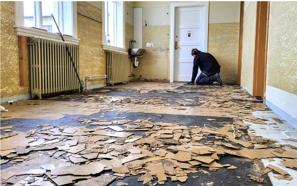
Jón Páll brýtur upp gamlar flisar og undirbýr fyrir parketlög