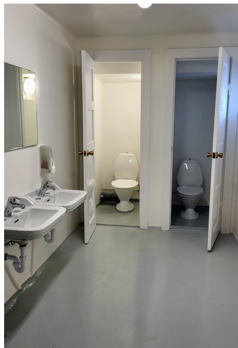
Gangur niður að salernum í kjallara nýmálaður og salerni máluð í hólf og gólf.