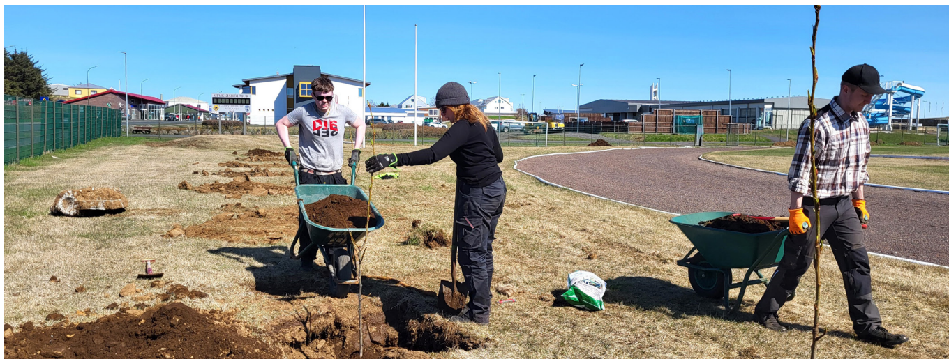
Sumarstarfsfólk í Áhaldahúsi sinnir gróðurverkum.

Eins og glöggir vegfarendur hafa eflaust tekið eftir hefur Skógræktarfélag Stykkishólms undanfarið unnið að því í samstarfi við sveitar-