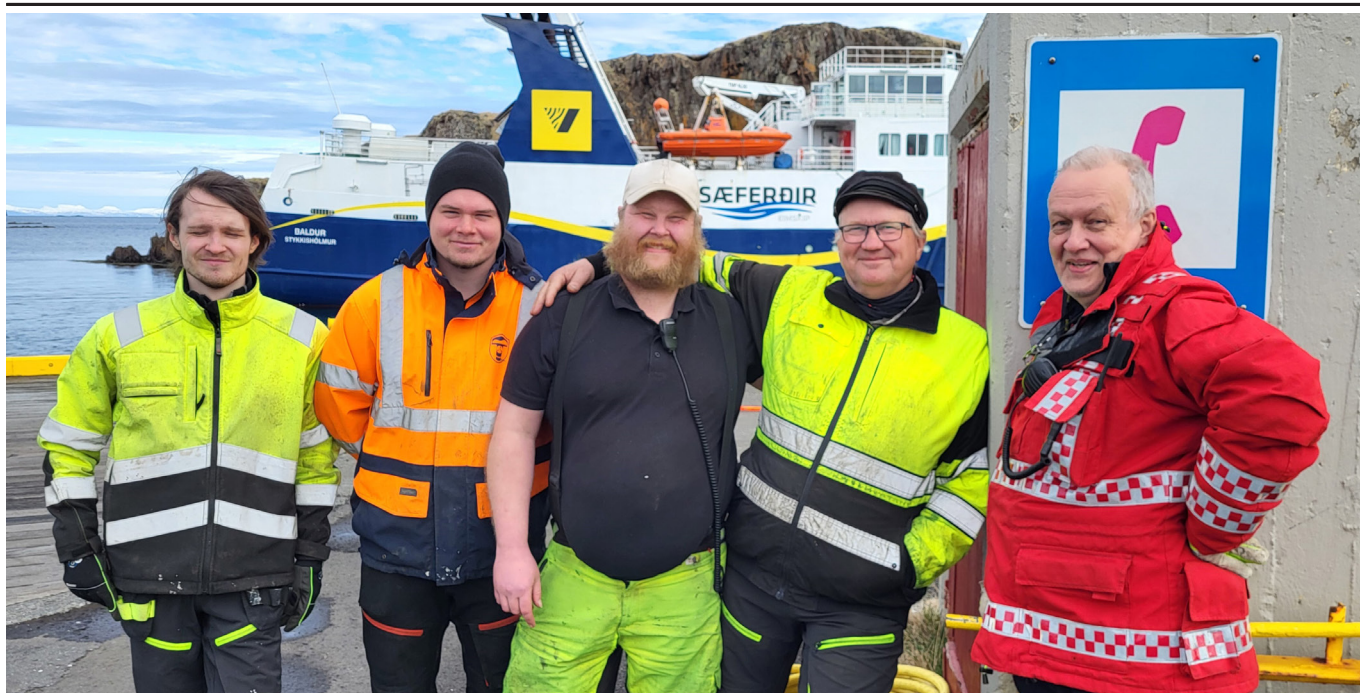
Ekki amalegt að koma í land þar sem þessi hópur situr í móttökunefnd.