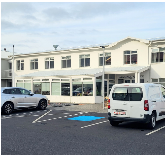
Íbúafundur á Höfðaborg.

Svæðisgarðurinn Snæfellsnes, í samstarfi við Snæfellsjökulþjóðgarð, býður til kynningar og umræðufundar á Höfðaborg mánudaginn 3. júní kl. 14:00. Yfirskrift fundarins er „Snæfellsnes – fyrsti UNESCO vistvangur á Íslandi?“ Nú þegar hafa yfir 700 svæði, í 124 löndum, uppfyllt skilyrði til að kallast UNESCO vistvangur. Til að komast í þeirra raðir þurfa svæði að búa yfir náttúrumin-