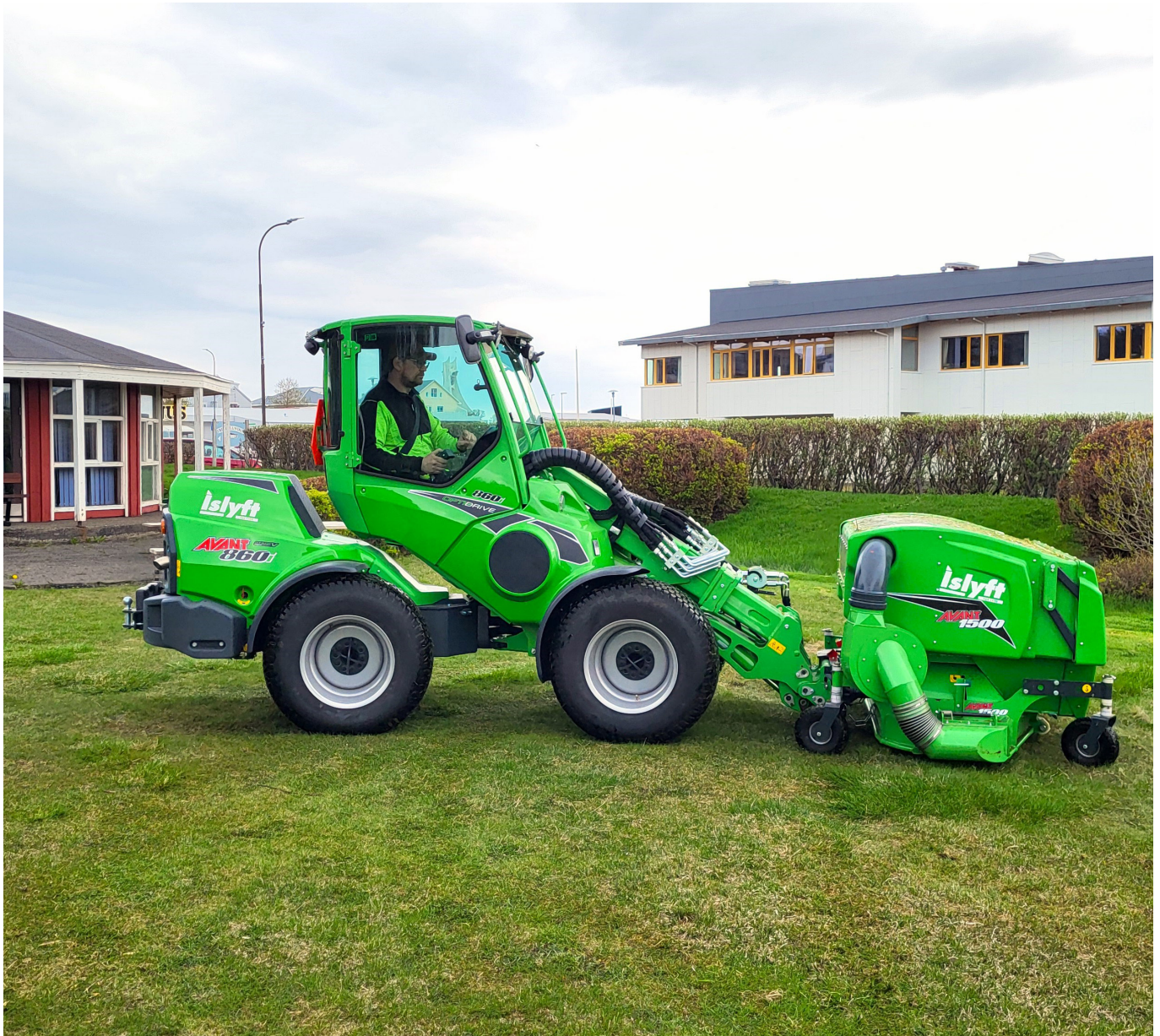
Sláttur er hafinn.