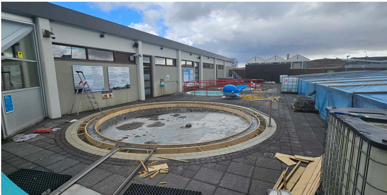
Framkvæmdir í fullum gangi við sundlaugina.

Eins og greint var frá á vef sveitarfélagsins er sundlaug Stykkishólms nú lokuð vegna viðhalds. Búið er þó að opna innilaugina. Viðhaldsframkvæmdir ganga vel en búið er að reisa einfalda yfirbyggingu yfir sundlaugi-