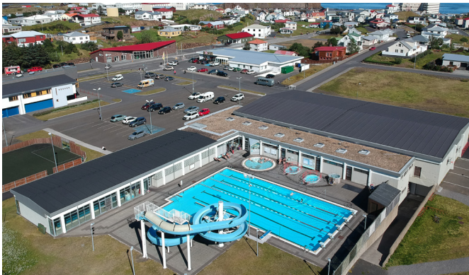
Sátan, rokkhátíð, fer fram í íþróttamiðstöðinni.

Sátan verður haldin dagana 6.-8. júní næstkomandi. Sátan er þriggja daga þungarokkshátíð haldin í íþróttamiðstöðinni í Stykkishólmi. Hátíðin leggur áherslu á að bjóða upp á fjölbreytt úrval af frems-tu þungarokkshljómsveitum Íslands. Viðburðarhaldarar gera ráð fyrir að hátt í 800 manns sæki Hólminn heim í tengslum við hátíðina. Tónleikar hefjast í íþróttamiðstöðinni kl. 15:50 dagana þrjá og standa fram yfir miðnætti. Óhætt er því að gera ráð fyrir blómlegu mannlífi í Stykkishólmi þessa helgi.