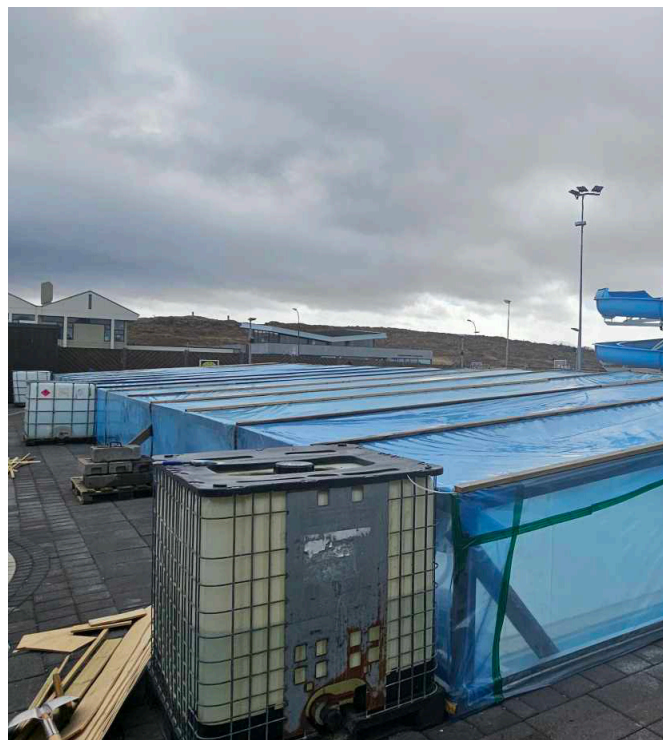
Hægt er að fylgjast með framgangi máls á facebooksíðu sundlaugar Stykkishólms.