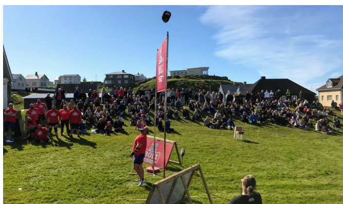
Mynd frá Vestfjarðarvíkingnum sem fram fór í Stykkishólmi sumarið 2020.

listarlíf með sínum verkum. Njallabekkurinn er staðsettur á hólnum við Tónlistarskóla Stykkishólms þar sem hægt er að tilla sér niður og njóta útsýnis yfir bæ og breiðan fjörð. Á myndinni hér til hliðar má sjá hluta af 74' árgangnum og fjölskyldu Njalla við bekkinn fyrir framan Tónlistarkólann.