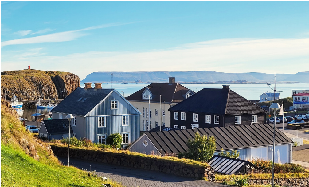
Staða fjármála- og skrifstofustjóra kemur í stað bæjarritara.

Sveitarfélagið Stykkishólmur hefur undanfarið auglýst eftir fjármála- og skrifstofustjóra fyrir sveitarfélagið.