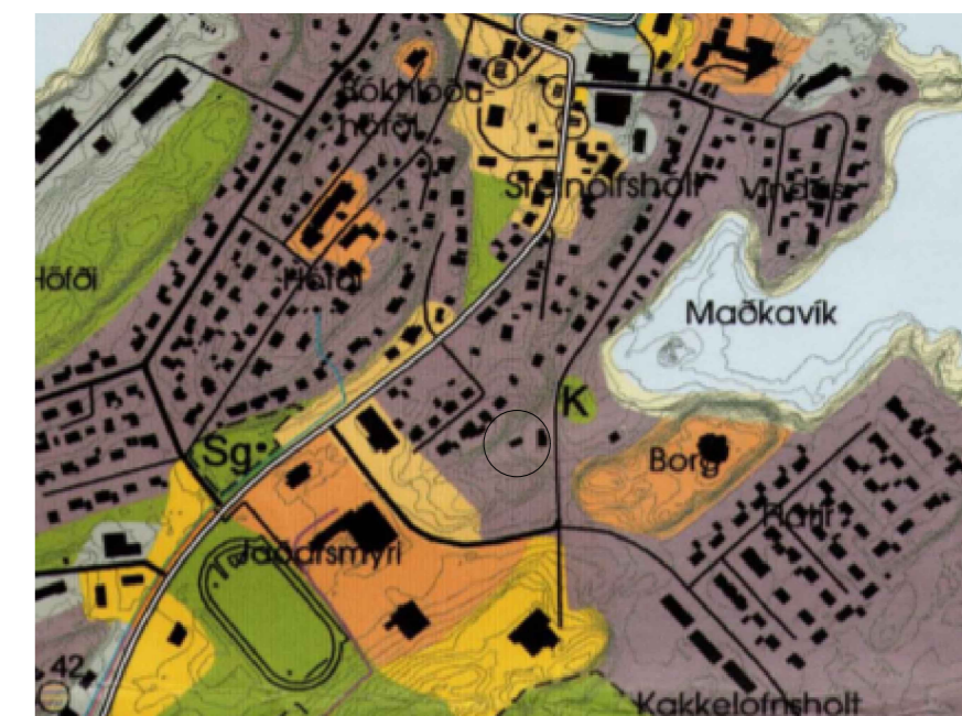
Aðalskipulag Stykkishólmsbæjar 2002-2022