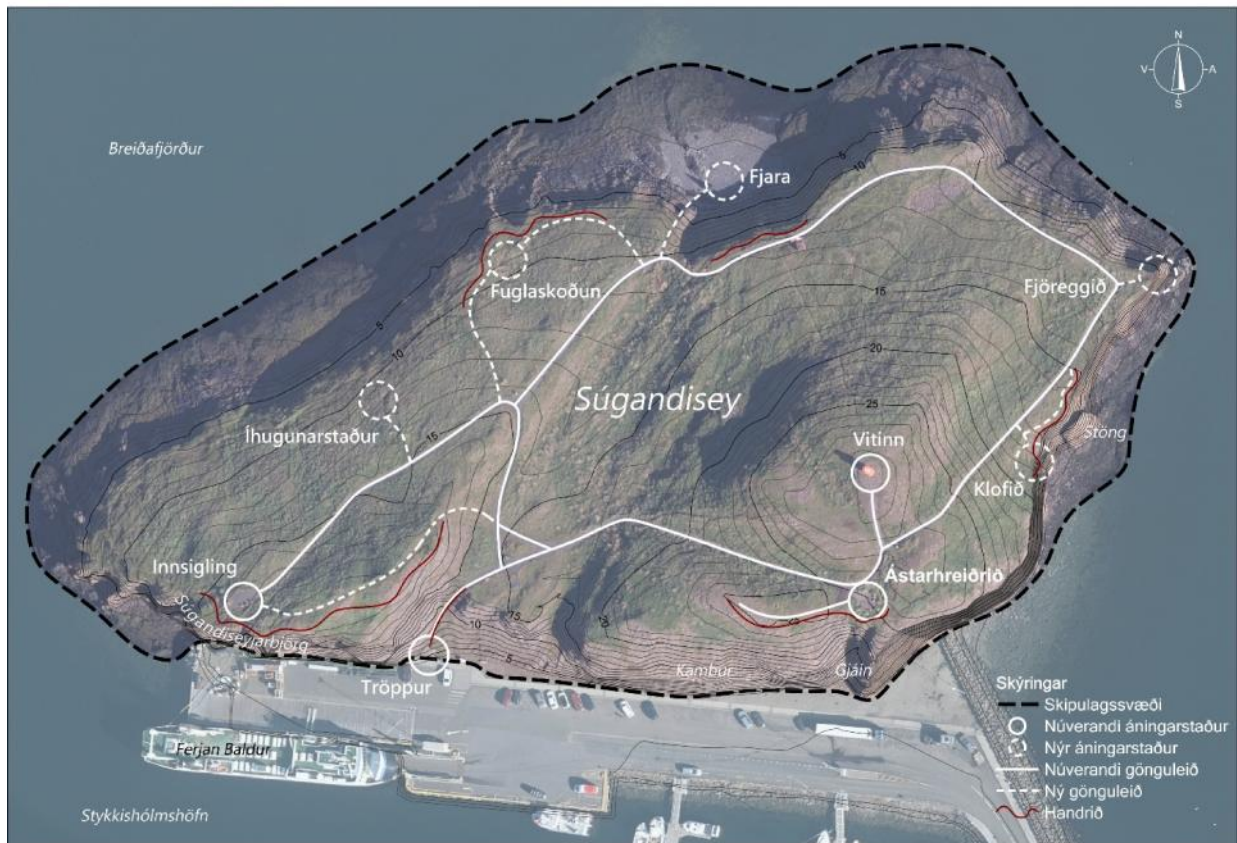
Uppdráttur sýnir fyrirhugað skipulagssvæði, tillögu að staðsetningu áningarstaða, gönguleiða og handriða.

Í deiliskipulaginu verður lögð fram tillaga að legu göngustíga og áningarstaða innan skipulagssvæðis. Stuðst er meðal annars við rannsókn Umhverfisstofnunar, Ferðahegðun við Súgandisey , sem framkvæmd var í júlí 2020, við ákvörðun um legu göngustíga og áningarstaða. Búið er nú þegar að leggja megin stíga innan eyjunnar og gengið er út frá því að þeir haldi sér í tillögu deiliskipulags. Enn fremur er gert ráð fyrir að það verði bætt við minni stígum. Samanber rannsókn Umhverfisstofnunar, og rýni í gróðurslit vegna átroðnings, er augljós tilhneiging hjá fólki að ganga mjög nærri klettabrúnum. Hingað til hefur verið reynt að leiða fólk frá þeim, eins og núverandi göngustígakerfi ber glögg merki. Með notkun á handriði er hægt að koma til móts við þessa hegðun fólksins og færa gönguleiðir og áningarstaði nær brúnunum, en auka samtímis öryggi fólks og bæta náttúruupplifun þeirra.