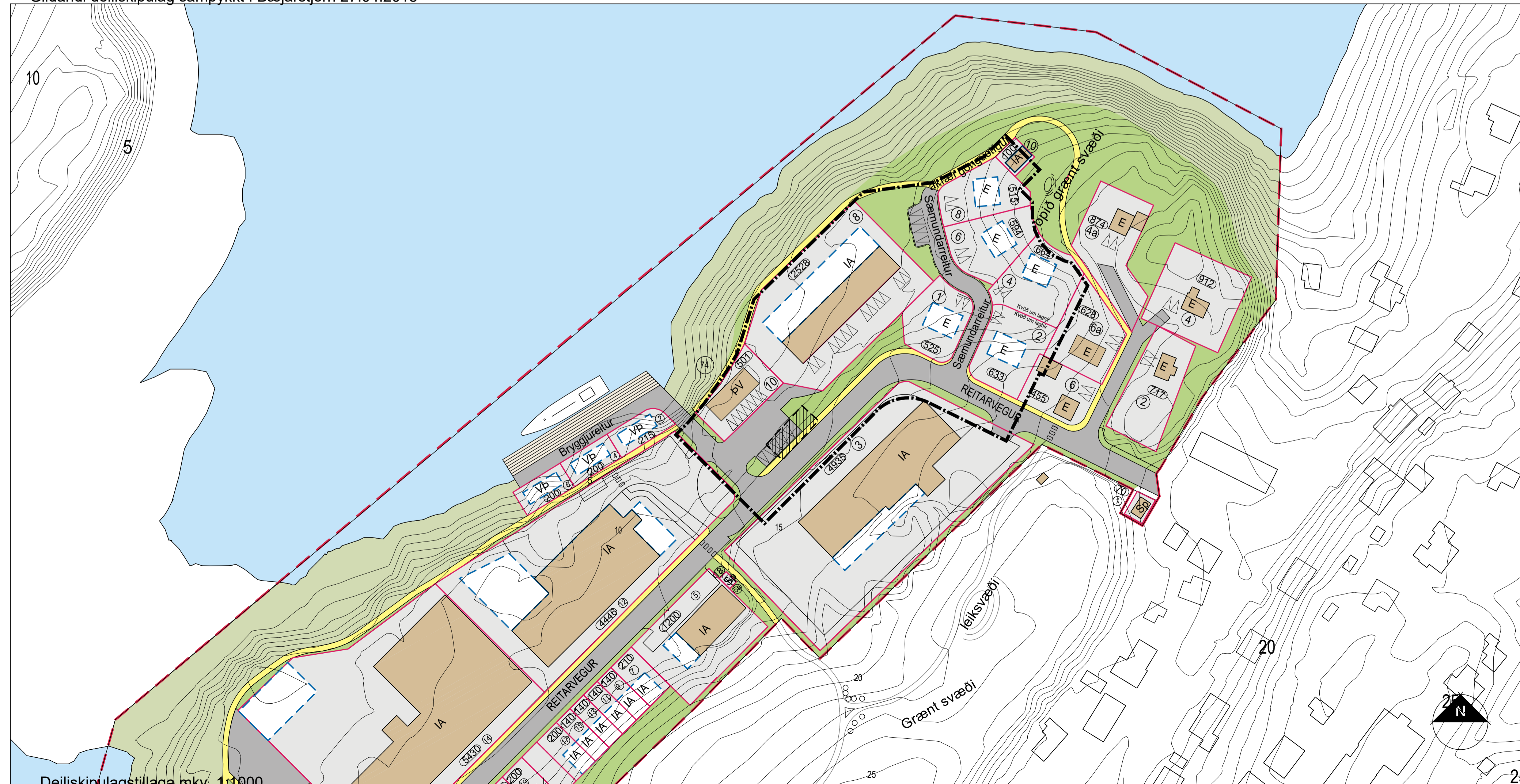
Deiliskipulagstillaga mkv. 1:1000