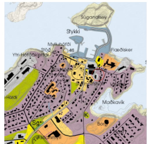
STYKKISHÓLMUR - AÐALSKIPULAG 2002 - 2022 Staðfest 09.07.2002

Hluti af gildandi deiliskipulagi, Stykkishólmur miðbær samþykkt 28.8.2003, með síðari breytingum. Hluti þess fellur úr gildi við samþykkt nýs deiliskipulags þar sem svæðið verður hluti þess nýja, Stykkishólmur miðbær, reitur austan Aðalgötu. Afmörkun beggja skipulaga verður eðlilegri með þessum hætti. Fyrirkomulagi bílastæða er breytt lítillega á þessu svæði.