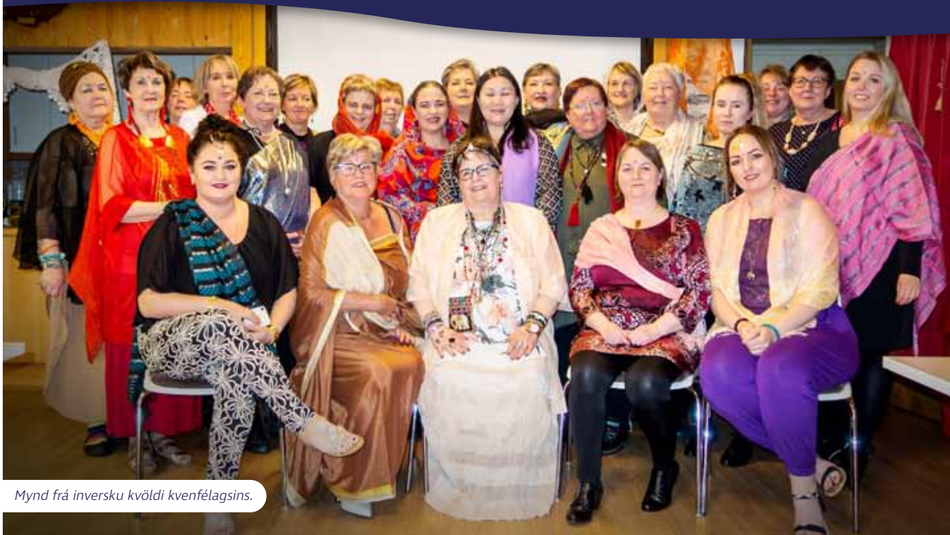
Mynd frá innersku kvöldi kvenfélagsins.