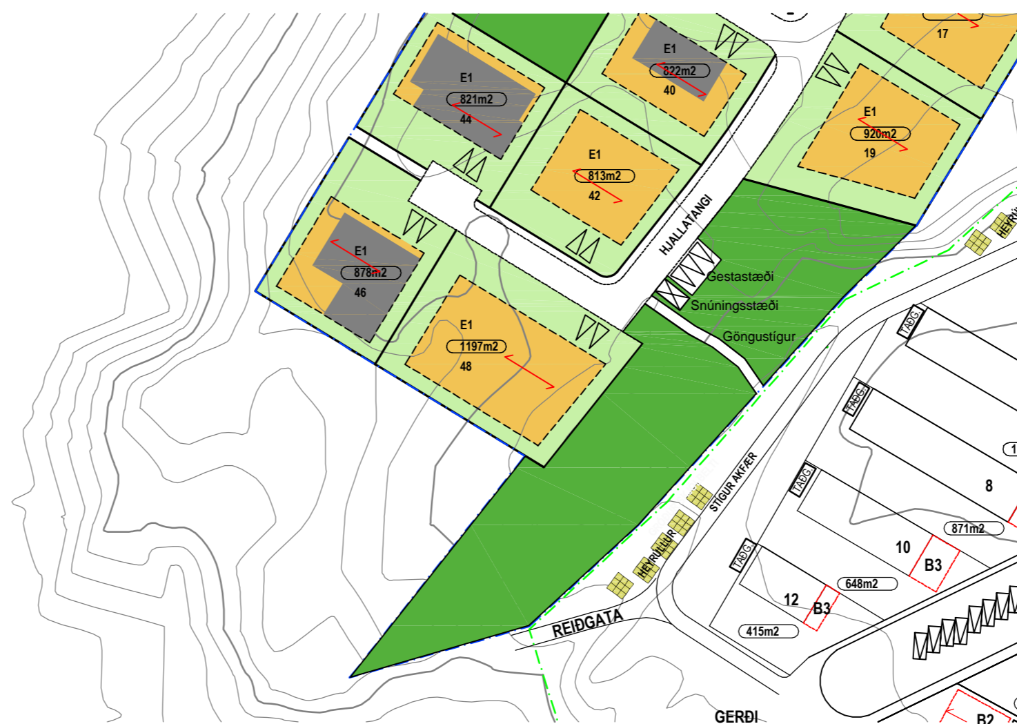
Tillaga að breytingu á deiliskipulagi. 1:1000