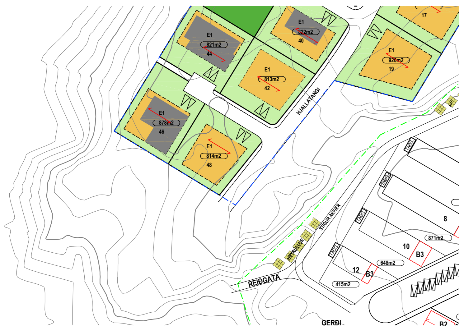
Núgildandi deiliskipulag. 1:1000