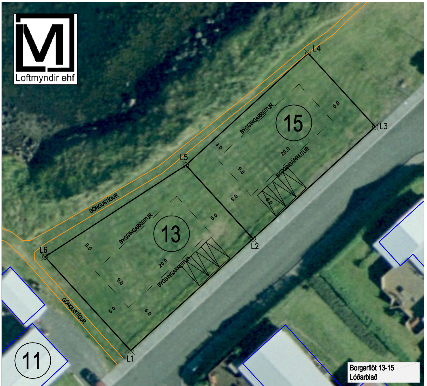
Borgarflöt 13-15 Lóðarblað

ATH - Loftmynd undir er einungs til viðmiðunnar