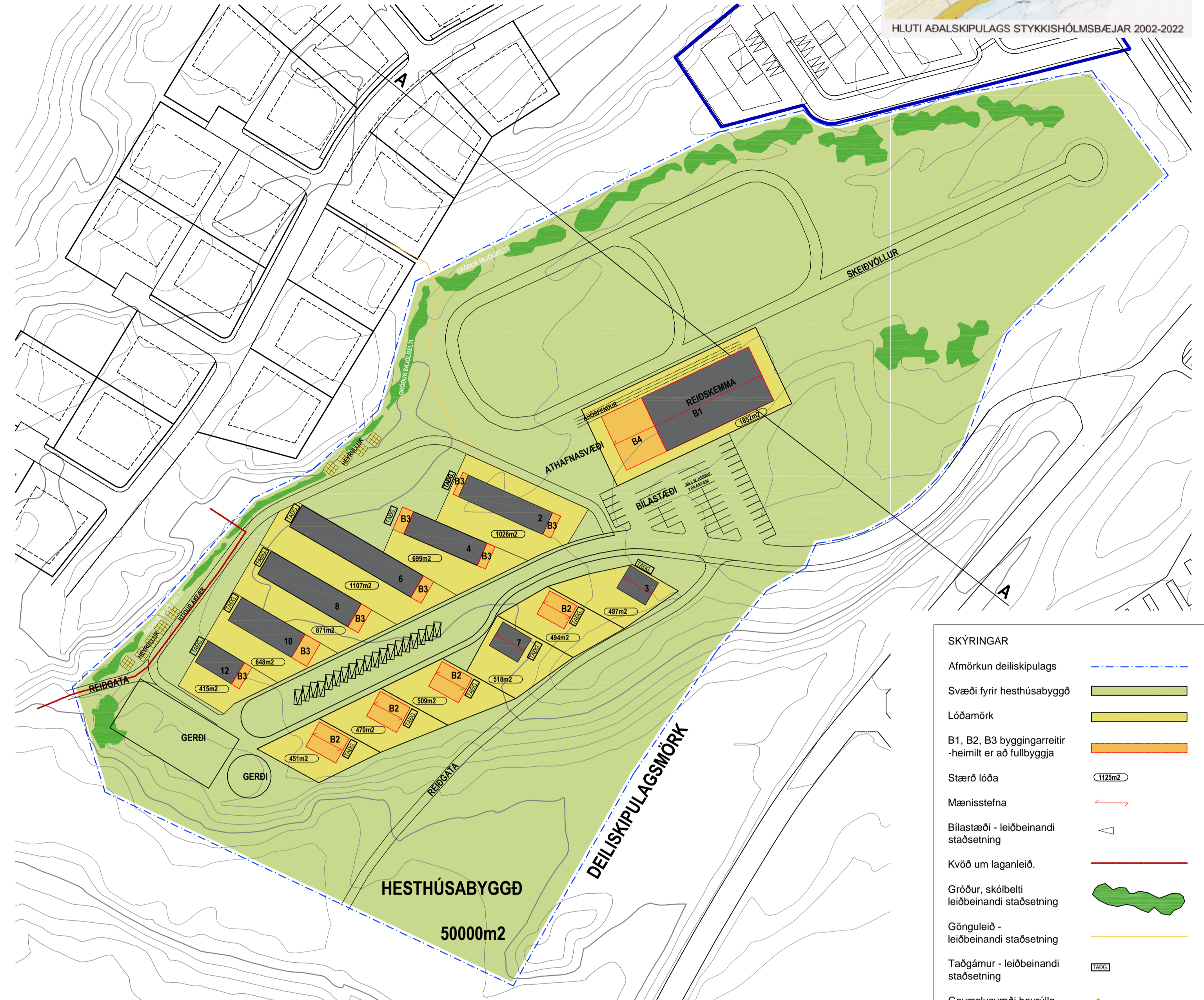
Tillaga að breytingu á deiliskipulagi. 1:1000