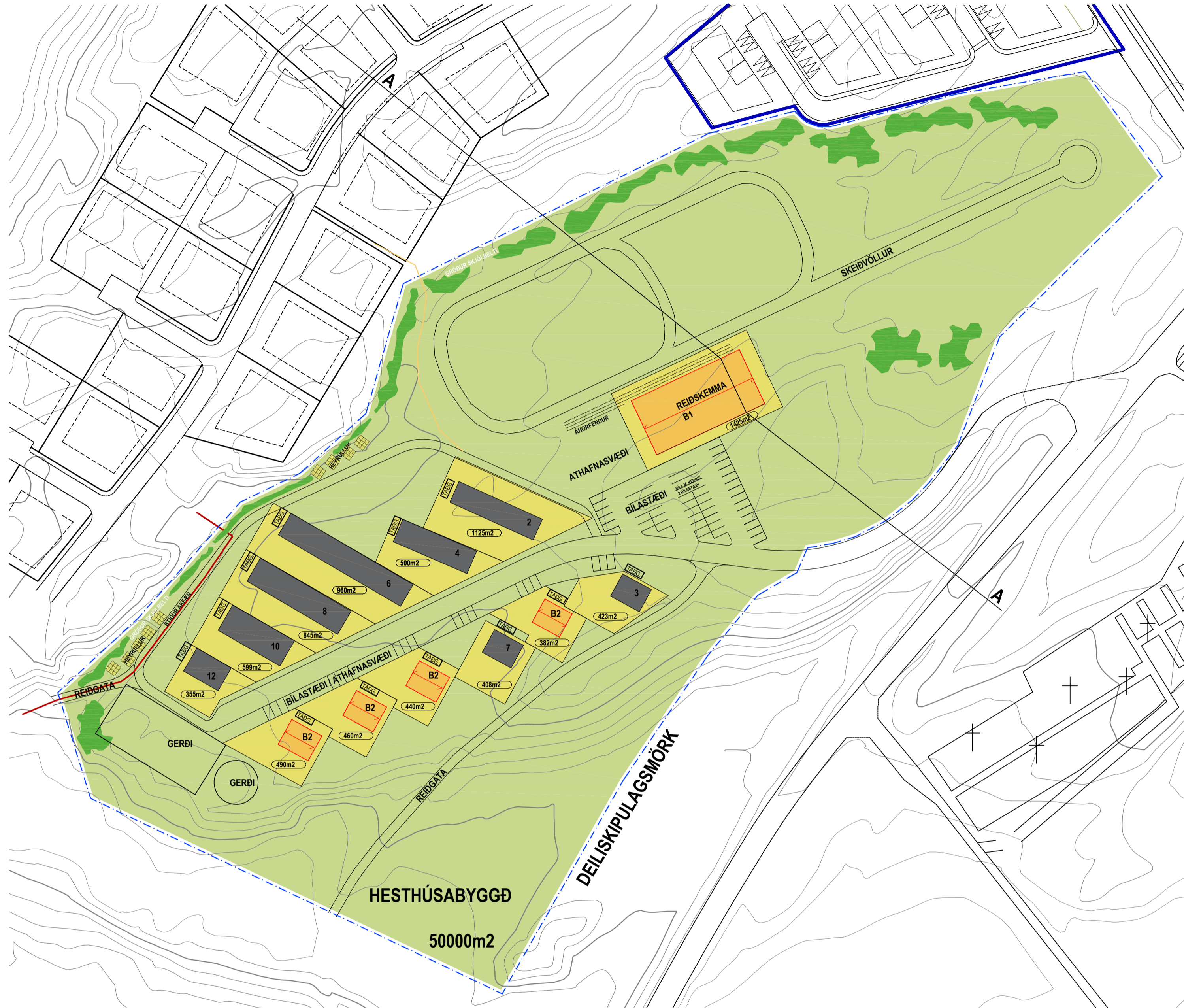
Núgildandi deiliskipulag. 1:1000

HLUTI AÐALSKIPULAGS STYKKISHÓLMSBÆJAR 2002-2022